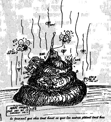
NEVE... le journal qui est tout haut ce que les autres font tout bas